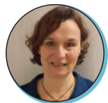
Anne POSTIC Commissaire à la prévention et à la lutte contre la pauvreté