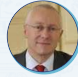
Pierre ORY Préfet du Maine et Loire