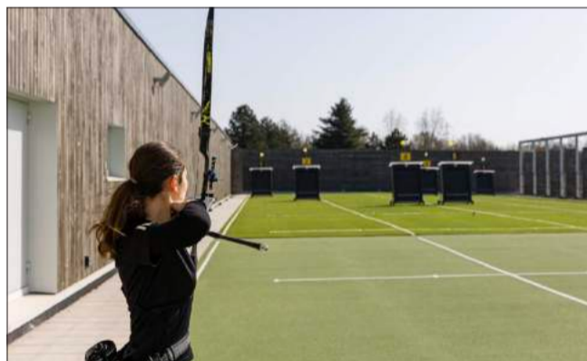
L'État a soutenu la création du CREPS à hauteur de 5,5 M€.