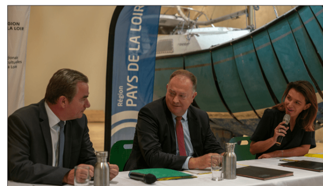
Signature du volet culture et patrimoine, à la Chapelle du Genêteil, Centre d'Art contemporain à Château-Gontier-sur-Mayenne, inscrit au CPER 2021-2027

Signé le 31 août 2022, l'avenant au CPER dédié à la culture et à la valorisation du patrimoine prévoit un engagement paritaire de l'État et de la Région à hauteur de 22,5 M€ chacun pour 20 opérations emblématiques.