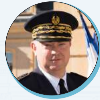
Didier MARTIN Préfet de la région Pays de la Loire Préfet de la Loire-Atlantique

Comme 2020 et 2021, cette année aura encore été marquée par la pandémie Covid-19 ; se sont rajoutées les nombreuses conséquences de la guerre en Ukraine même si les répercussions économiques et sociales en ont été réduites par l'action des pouvoirs publics et par la réactivité des collectivités, entreprises, associations. Tous les services de l'État en Pays de la Loire ont de nouveau été au rendez-vous de cette année complexe.