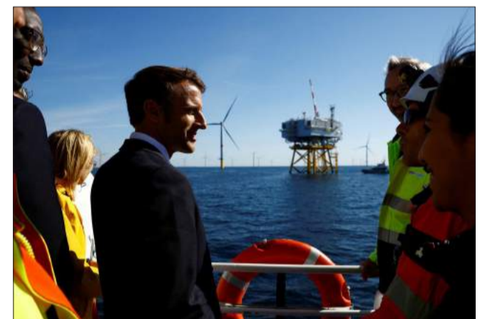
Emmanuel Macron, lors de l'inauguration du parc éolien à Saint-Nazaire

Le parc éolien du banc de Guérande, doté de 80 éoliennes d'une puissance de 480 MW, produit l'équivalent de la consommation électrique annuelle de 700 000 personnes, soit 20 % de la consommation en Loire Atlantique.