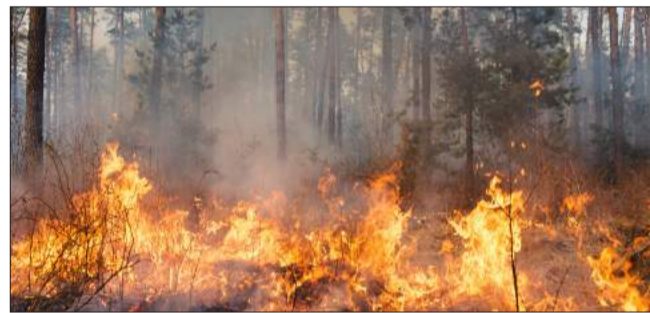
Un été 2022 marqué par les feux de forêt avec 2200 ha brûlés