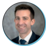
Johann FAURE Sous-préfet à la relance (jusqu'au 16/08/2022)